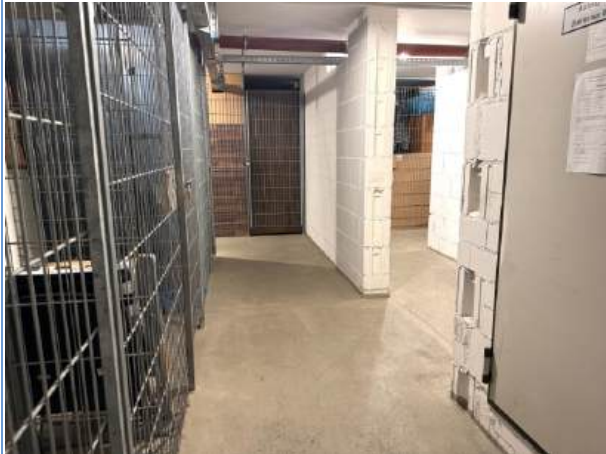
Kellerboxen mit separaten Stromanschlüssen je WE