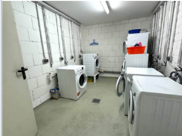
Gemeinsamer Waschsalon im Keller