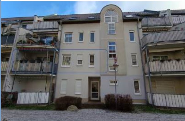
Hausansicht inkl. Markierung der WE (Westseite)

Zimmer: 3,00 Wohnfläche ca.: 88 m 2 Kaufpreis: 217.500,00 EUR