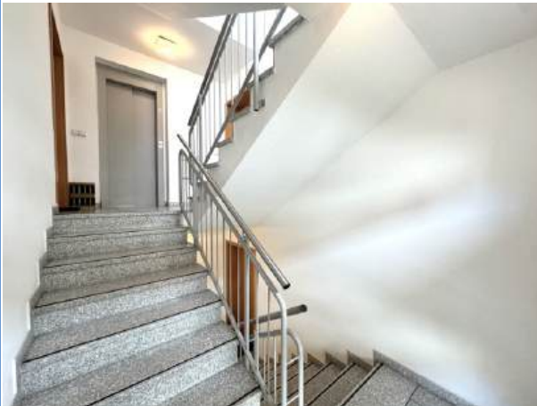
Treppenhaus (Zugang zur WE)