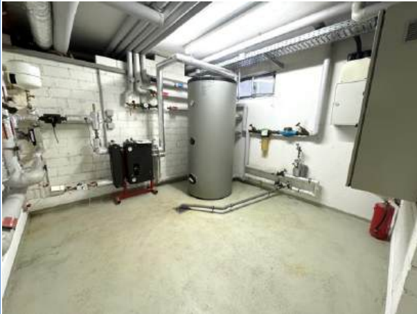
Heizungsraum des Hauseingangs (Zentrale separat)