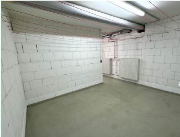
Gemeinsamer Trockenraum neben Waschsalon

Zimmer: 3,00 Wohnfläche ca.: 88 m 2 Kaufpreis: 217.500,00 EUR