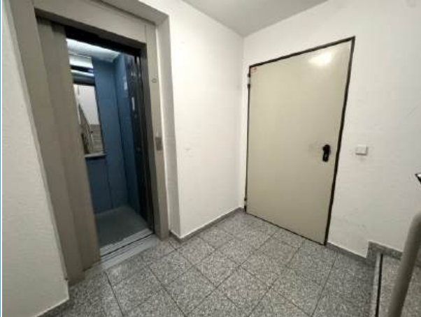
UG-Treppenhaus inkl. Aufzug

Zimmer: 3,00 Wohnfläche ca.: 88 m 2 Kaufpreis: 217.500,00 EUR