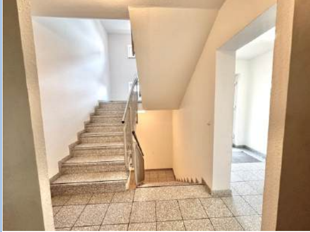
EG-Treppenhaus (Blick aus Aufzug)