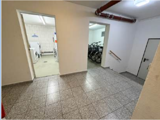
Zugang zur Garage, Waschsalon und Fahrradraum