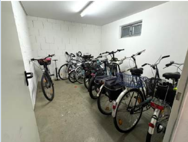
Gemeinsamer Fahrradraum im Keller