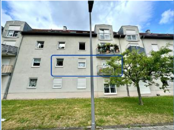
Hausansicht inkl. Markierung der WE (Ostseite)